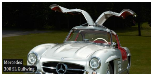
Mercedes 300 SL Gullwing

Tidsplan: 08.30: Afgang fra Randers 11.00. Ankomst til Strøjer 13.00 Turen går hjemad 13.30 Spisning 16.00 Hjemme i Randers igen