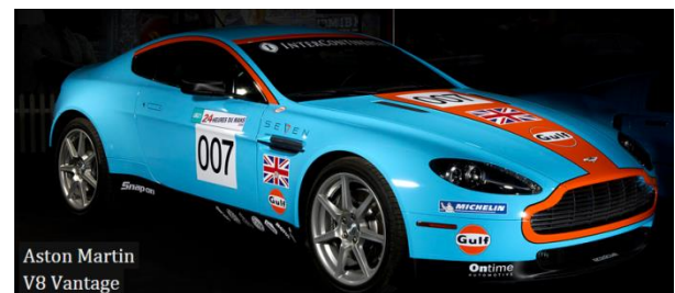
Aston Martin V8 Vantage

Det koster kun kr. 100,- for RAS medlemmer og påhæng. Prisen dækker: Bus, kaffe/the, øl og vand i bussen samt indgangsbillet Der kan bestilles sandwich til busturen til kr. 50,- Spisning på hjemturen er for egen regning